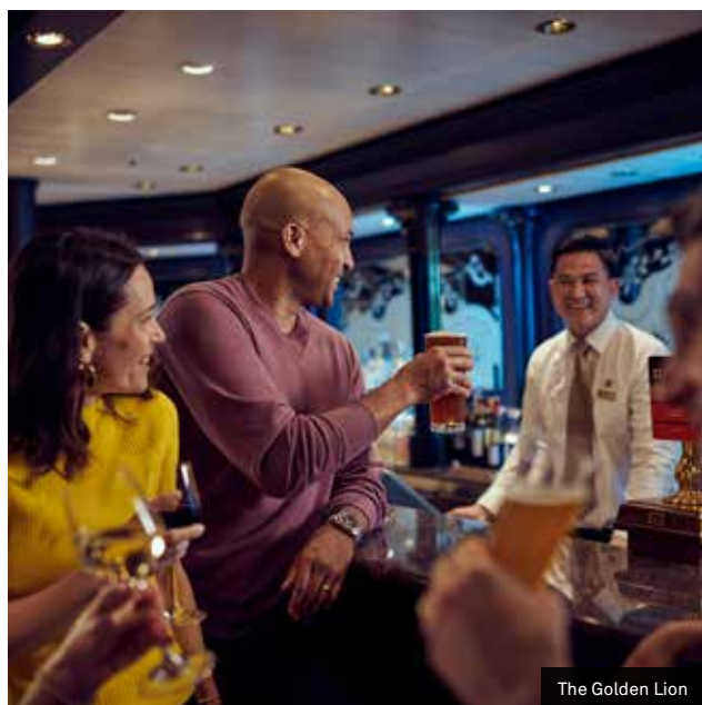
The Golden Lion

A bordo do Queen Elizabeth, os hóspedes podem visitar alguns dos lugares mais bonitos e remotos do mundo. Entre eles estão alguns dos destinos mais icônicos do mundo, como o Porto de Sidney, Fjordland na Nova Zelândia e as geleiras do Alasca.