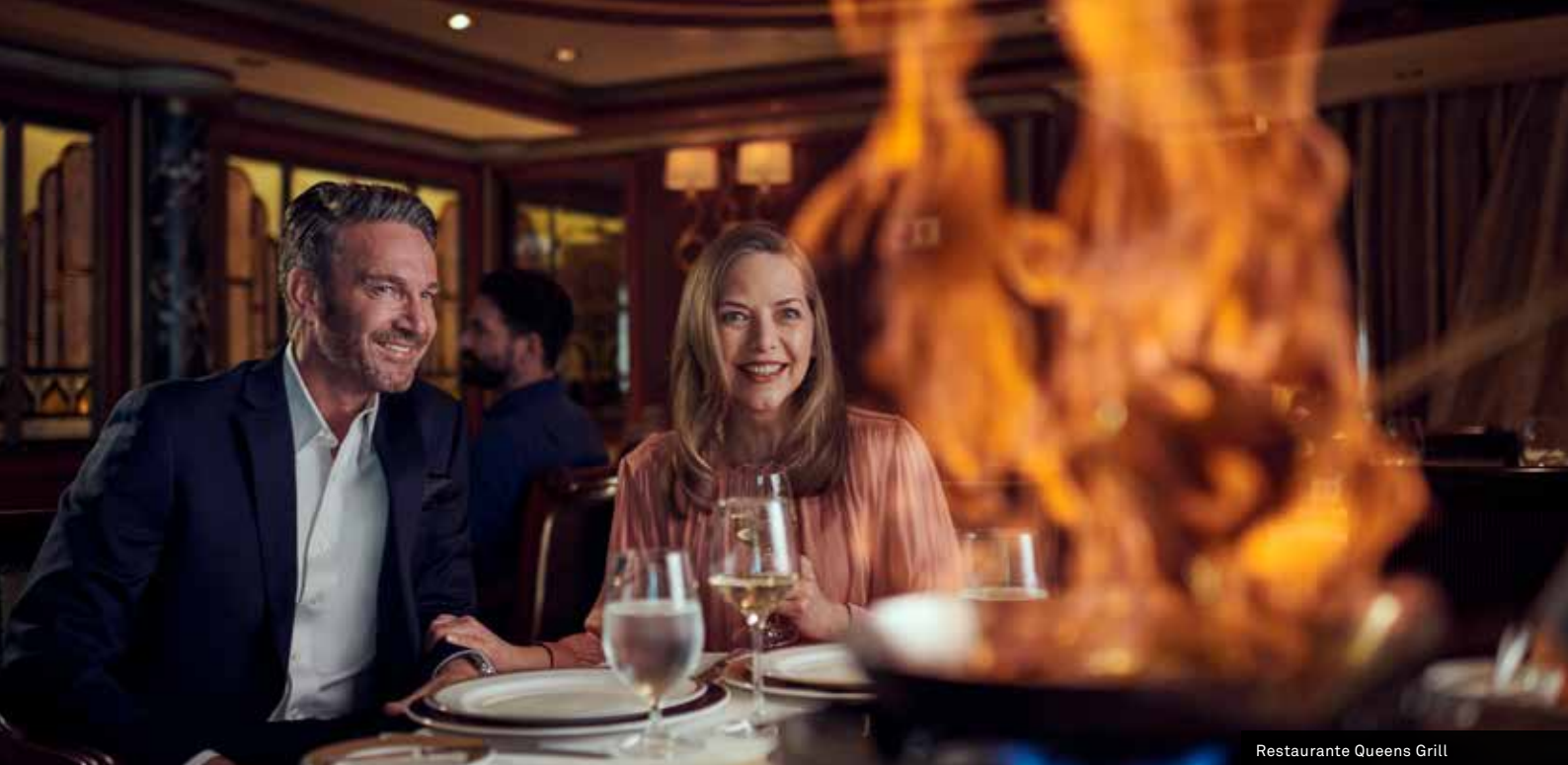
Restaurante Queens Grill